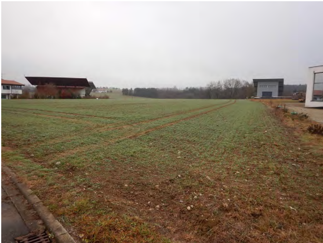
Blick auf Ackerfläche östlich des südlichen Firmengeländes, Blickrichtung Süden.