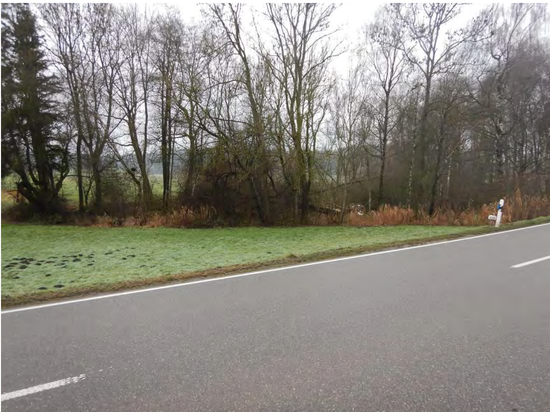
Blick von der Straße im Norden des Gebietes auf Feucht-Waldbiotop mit Röhricht. Blickrichtung Westen.