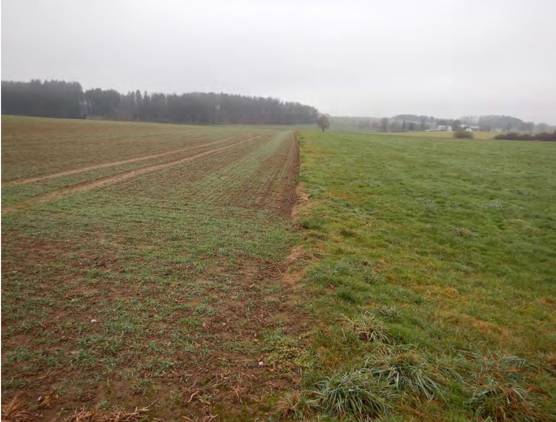
Blick auf Acker (links) und Grünland (rechts) westlich des Schotterwegs, Blickrichtung Westen.