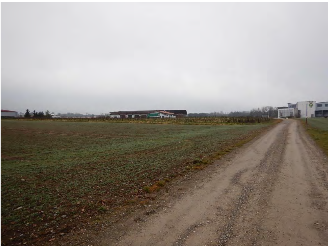
Blick vom Schotterweg auf Ackerfläche und Blütmischung zwischen nördlichem und südlichem Firmengelände. Blickrichtung Süden.