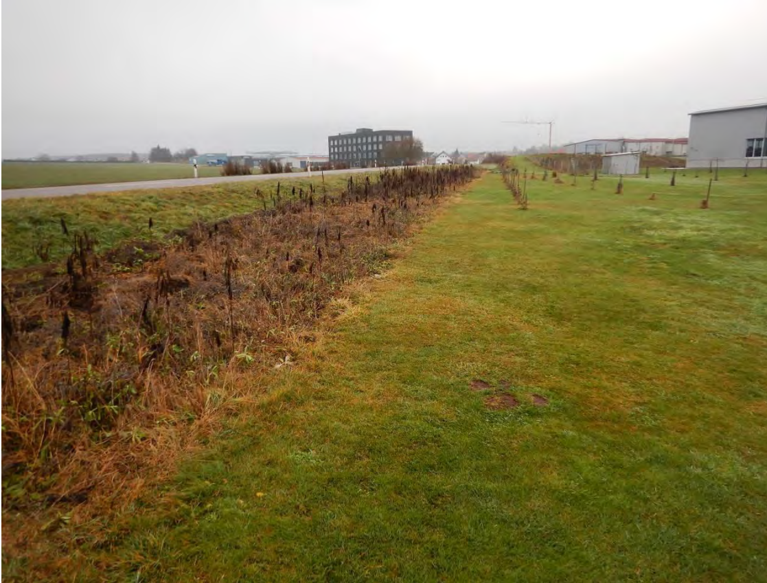
Blühmischung entlang der Straße im Norden des Gebietes, Blickrichtung Osten.