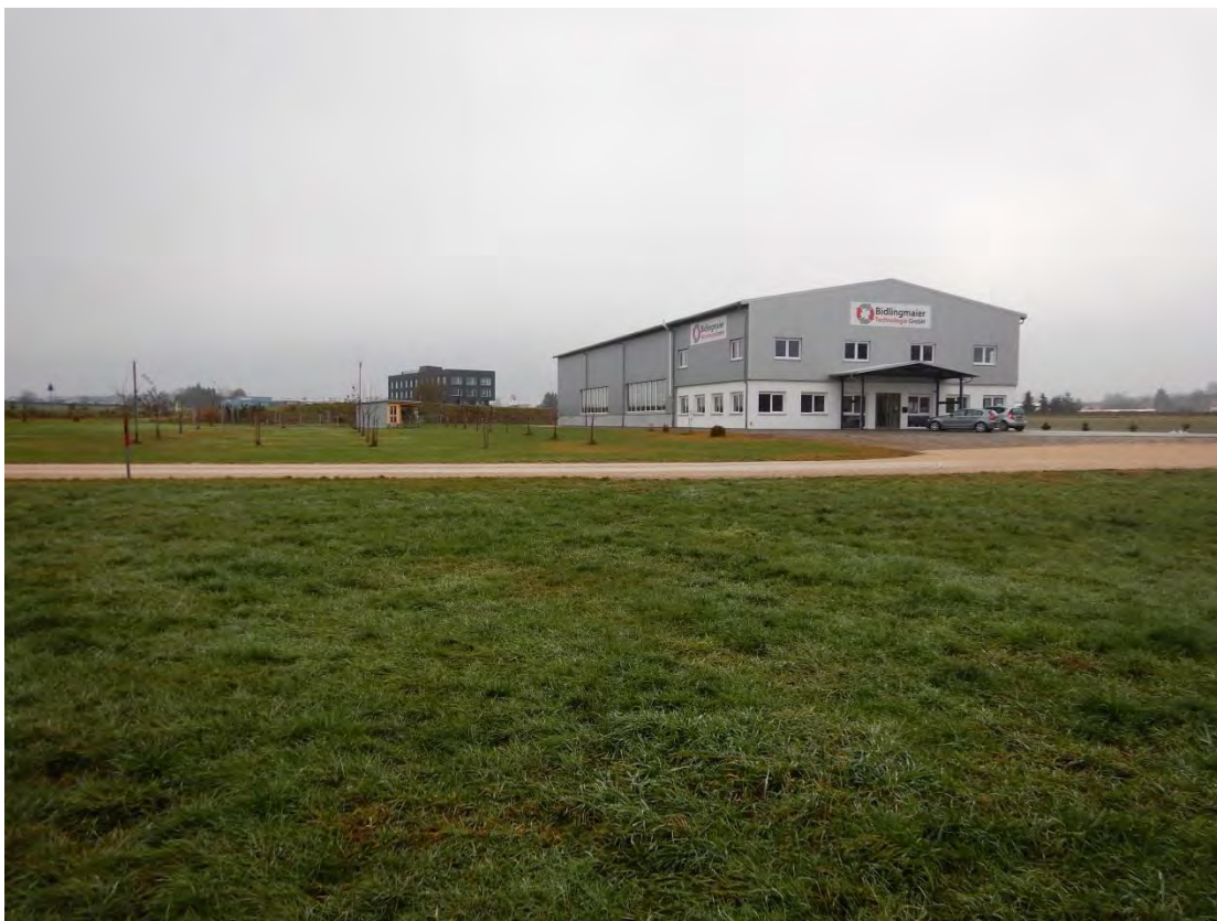
Rechts: Firmengelände im Norden des Gebietes, links: vermutlich Ausgleichsmaßnahme mit 30 gepflanzten Bäumen und zwei Sitzstangen für Greifvögel. Blickrichtung Osten.