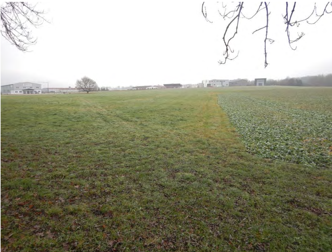
Westliche Gebietsgrenze, Blickrichtung Süden.