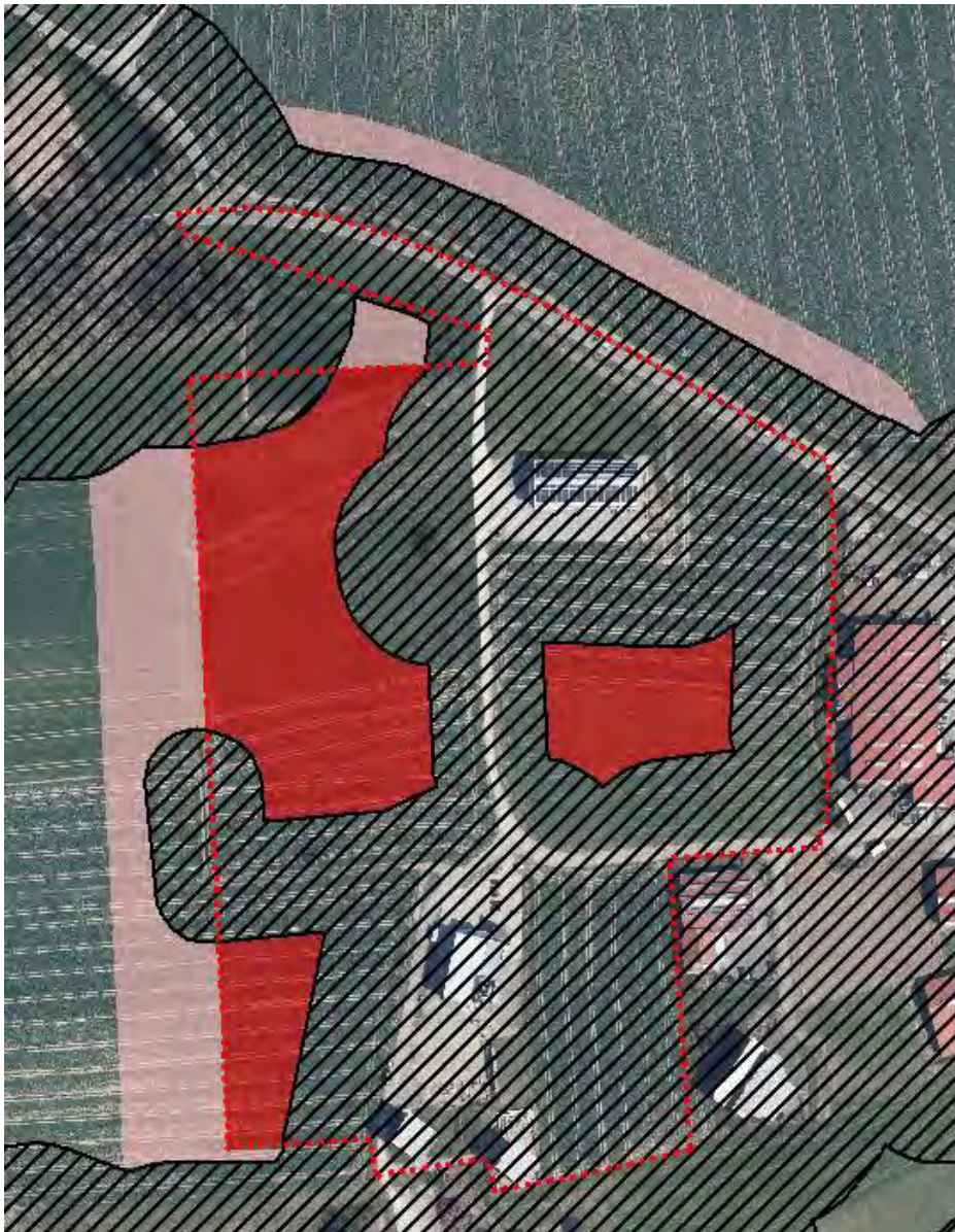
Abbildung 2: Meidekarte der Feldlerche. Schwarz: Aktuell gemiedene Fläche; rot: Mit Bebauung entfallende Fläche innerhalb des Vorhabensgebiets; rosa: Mit Bebauung entfallende Fläche außerhalb des Vorhabensgebiets

Fläche von ca. 2,2 ha verdrängt (siehe Abbildung 2). Daher wird eine Kartierung dieser Art empfohlen.