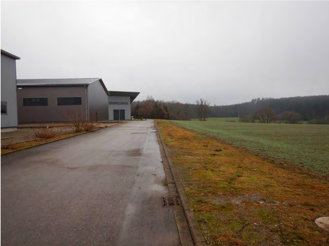
Blick entlang des Asphaltweges am südlichen Firmengelände, Blickrichtung Süden.