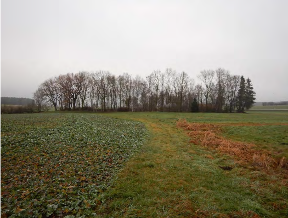
Westliche Gebietsgrenze, Blick nach Norden auf Grasweg zum Feucht-Wald-Biotop.