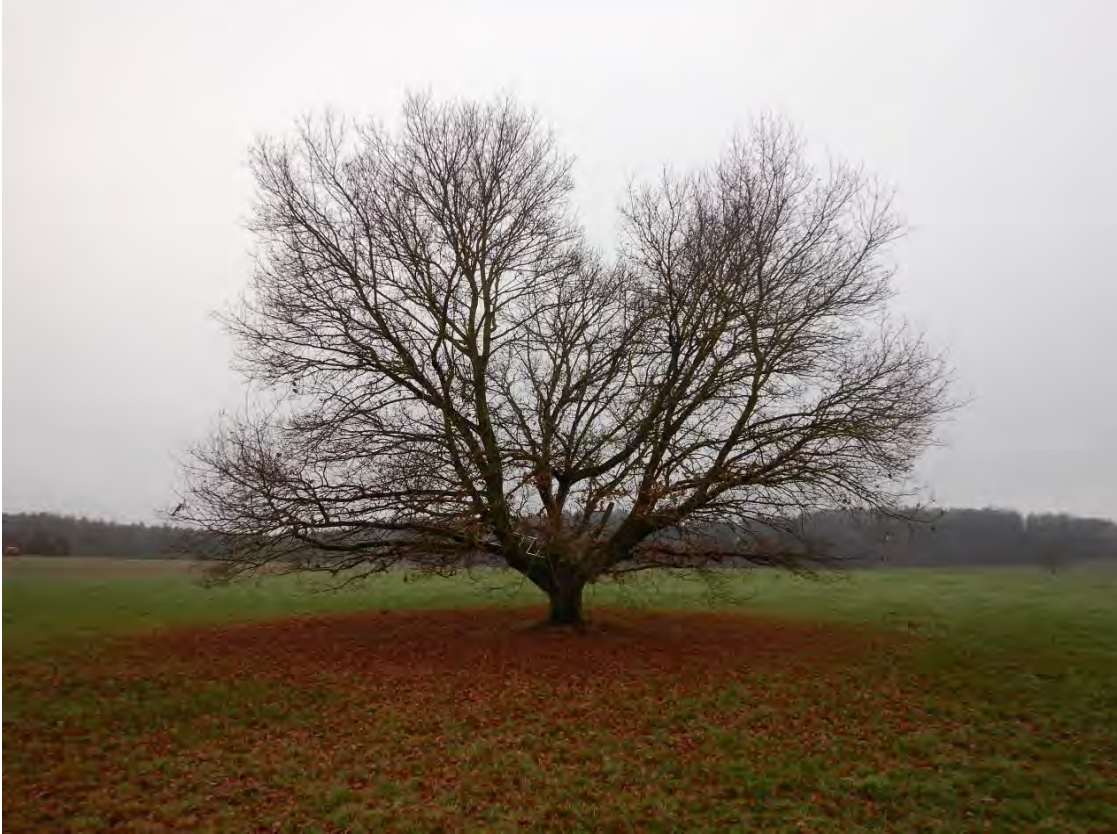
Große Eiche mittig im Gebiet, Blickrichtung Westen.