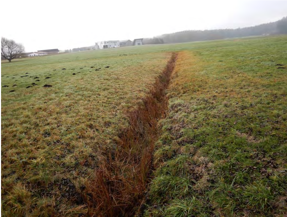
Graben im Nordwesten des Gebietes, Blickrichtung Süden