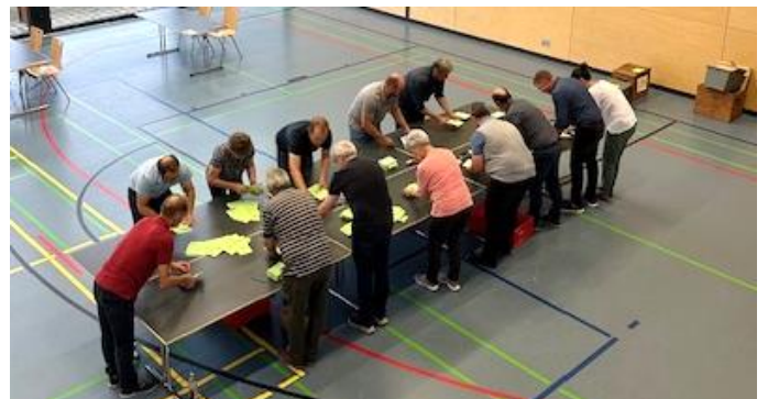
Fleißige Wahlhelfer bei der Arbeit. Zunächst wurden die Wahlbriefe geöffnet und die Stimmzettel kontrolliert.