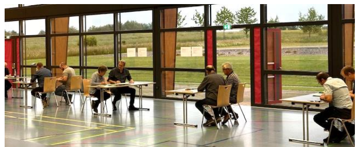
In einzelnen Zählgruppen wurden dann die Stimmzettel ausgewertet und in Zähllisten übertragen, mit denen die Ergebnisse festgestellt wurden.