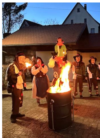
Das Fasnetsverbrennen mit anschließendem Kehraus