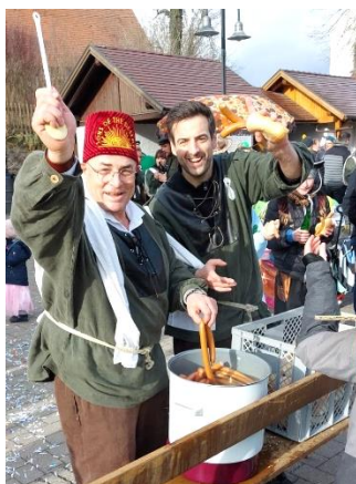
Am Fasnetssonntag durfte die traditionelle Wurst nicht fehlen