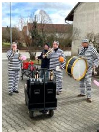
Am Glombigen war der gelungene Auftakt zur Hausfasnet

Ein ganz wichtiger Bestandteil unserer Zunft und unserer Fasnet: Die Guggamusik verbreitet geniale Stimmung bei jedem Auftritt.