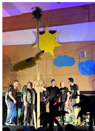
Der Gmoidsball in der MZH war in jeder Hinsicht ein Erfolg