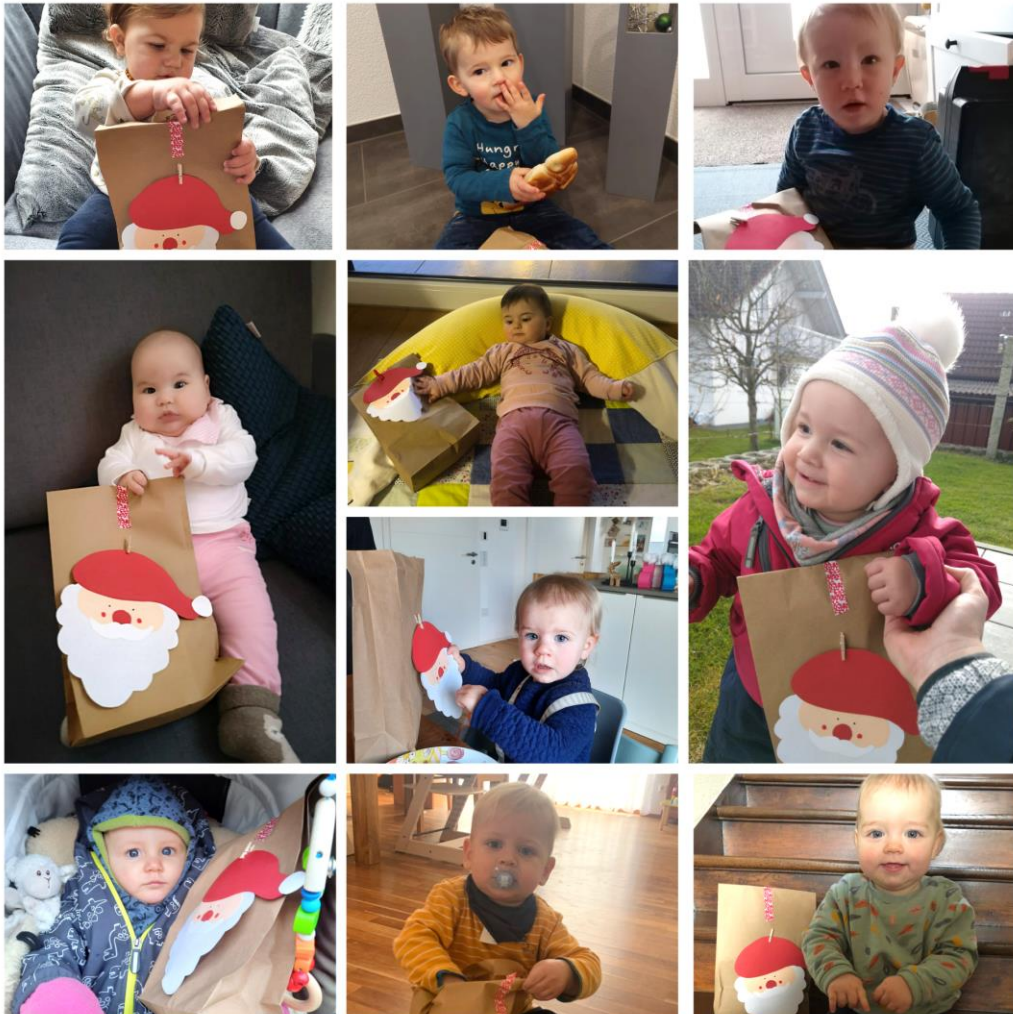
Alle Zwerge mit ihren Mamis und Papis

Mit Hilfe einer fleißigen Mama und einer Spende von einem lieben Opa, konnte euch der Nikolaus sichtlich eine kleine Freude machen. Wir sagen herzlichen Dank!